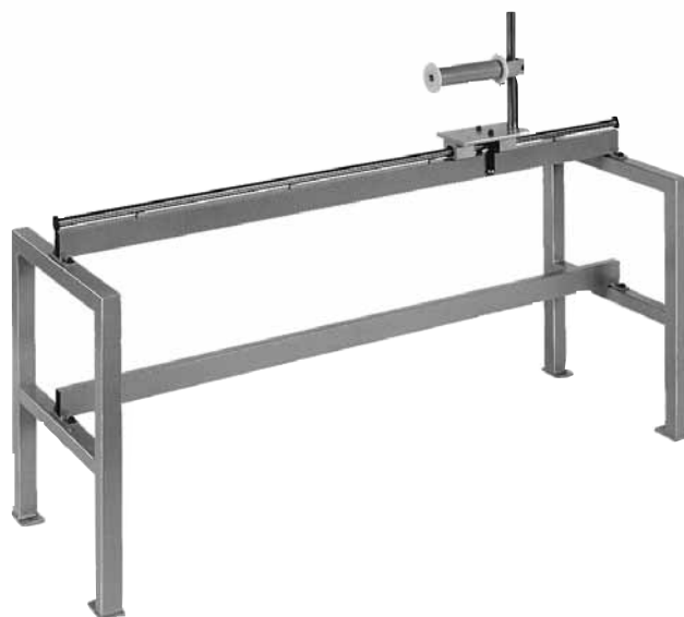
Rollbock zur Profilauflage